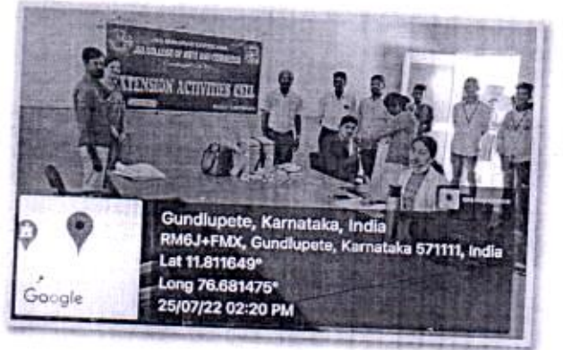
Gundlupete, Karnataka, India RM6J+FMX, Gundlupete, Karnataka 571111, India Lat 11.811649° Long 76.681475° 25/07/22 02:20 PM