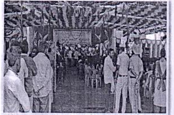
ದಿನಾಂಕ: 25.06.2022 ರಂದು "ಅಮೃತ ಭಾರತಿಗೆ ಕನ್ನಡದ ಆರತಿ" ಕಾರ್ಯಕ್ರಮದಲ್ಲಿ ಕಾಲೇಜಿನ ಅಧ್ಯಾಪಕರು/ಅಧ್ಯಾಪಕೇತರರು ಹಾಗೂ ವಿದ್ಯಾರ್ಥಿಗಳು ಭಾಗವಹಿಸಿದ್ದರು