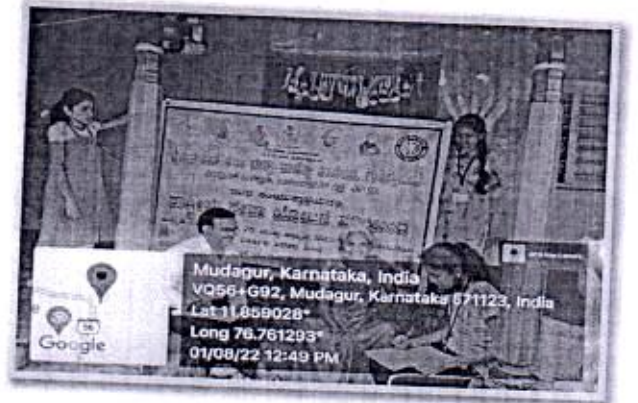
Mudagur, Karnataka, India VQ56+G92, Mudagur, Karnataka 571123, India Lat 11.859028° Long 76.761293° 01/08/22 12:49 PM