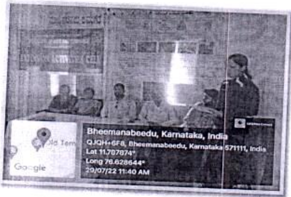
Bheemanabeedu, Karnataka, India QJQH+6F8, Bheemanabeedu, Karnataka 571111, India Lat 11.707874° Long 76.628644° 29/07/22 11:40 AM