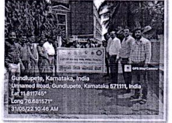
ದಿನಾಂಕ: 31.05.2022ರಂದು ರಾಷ್ಟ್ರೀಯ ಸೇವಾ ಯೋಜನೆ ಘಟಕದ ವತಿಯಿಂದ 'ವಿಶ್ವ ತಂಜಾಕು ರಹಿತ ದಿನಾಚರಣೆ'