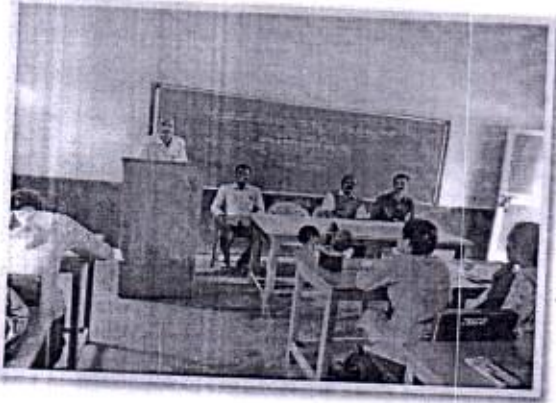
ದಿನಾಂಕ: 11.07.2022 ರಂದು ಭೂಗೋಳಶಾಸ್ತ್ರ ವಿಭಾಗದ ವತಿಯಿಂದ "ವಿಶ್ವ ಜನಸಂಖ್ಯಾ ದಿನಾಚರಣೆ" ವಿಶೇಷ ಉಪನ್ಯಾಸ ಕಾರ್ಯಕ್ರಮ