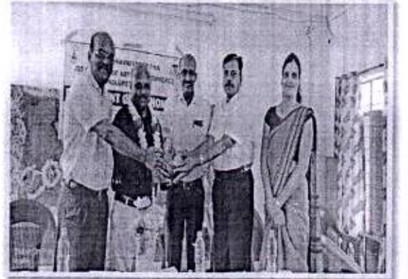
ದಿನಾಂಕ: 17.06.2022ರಂದು ಅರ್ಥಶಾಸ್ತ್ರ ವಿಭಾಗದ ವತಿಯಿಂದ ವಿಶೇಷ ಉಪನ್ಯಾಸ ಕಾರ್ಯಕ್ರಮ