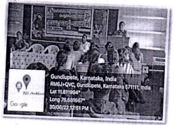
Gundlupete, Karnataka, India RM6J+QVC, Gundlupete, Karnataka 571111, India Lat 11.811994° Long 76.681687° 30/06/22 12:51 PM