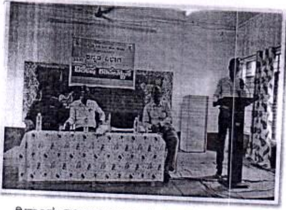
ದಿನಾಂಕ: 30.06.2022 ರಂದು ಕನ್ನಡ ವಿಭಾಗದ ವತಿಯಿಂದ ವಿಶೇಷ ಉಪನ್ಯಾಸ ಕಾರ್ಯಕ್ರಮ