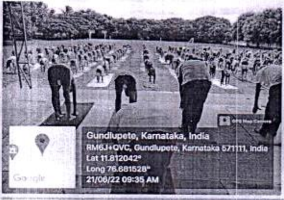
ದಿನಾಂಕ 21.06.2022ರಂದು ಕ್ರೀಡಾ ವಿಭಾಗದ ವತಿಯಿಂದ ರಾ. ಸೇ. ಯೋ. & ಎನ್‌ಸಿಸಿ ಸಹಯೋಗದೊಂದಿಗೆ ವಿಶ್ವ ಯೋಗ ದಿನಾಚರಣೆಯನ್ನು ಆಯೋಜಿಸಲಾಗಿತ್ತು.