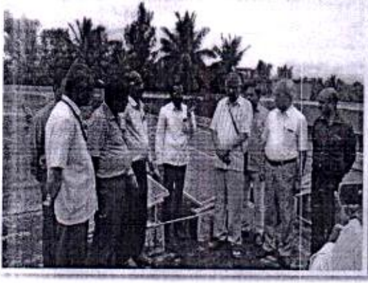
ದಿನಾಂಕ: 18.05.2022 ರಂದು ಅಧಿಕಾರಿಗಳ ತಂಡವು ಕಾಲೇಜಿಗೆ ಭೇಟಿ ನೀಡಿ ಸೌರ ಸ್ಥಾವರವನ್ನು ಪರಿಶೀಲಿಸಿದರು.